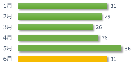
院内調査結果報告件数の推移（直近 6 か月）