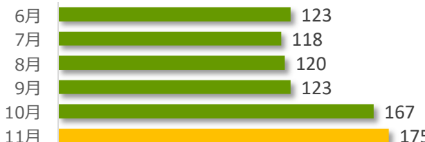
相談件数の推移（直近6か月）

11月の相談件数は175件で、相談者の内訳は医療機関が73件、遺族等が90件、その他・不明が12件でした。遺族等の求めに応じて相談内容をセンターが医療機関へ伝達したものは1件（累計152件）でした。医療機関から医療事故の判断について相談を受け、センター合議を開催し、医療機関へ助言したものは3件（累計428件）でした。