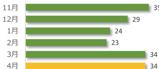
院内調査結果報告件数の推移（直近6か月）